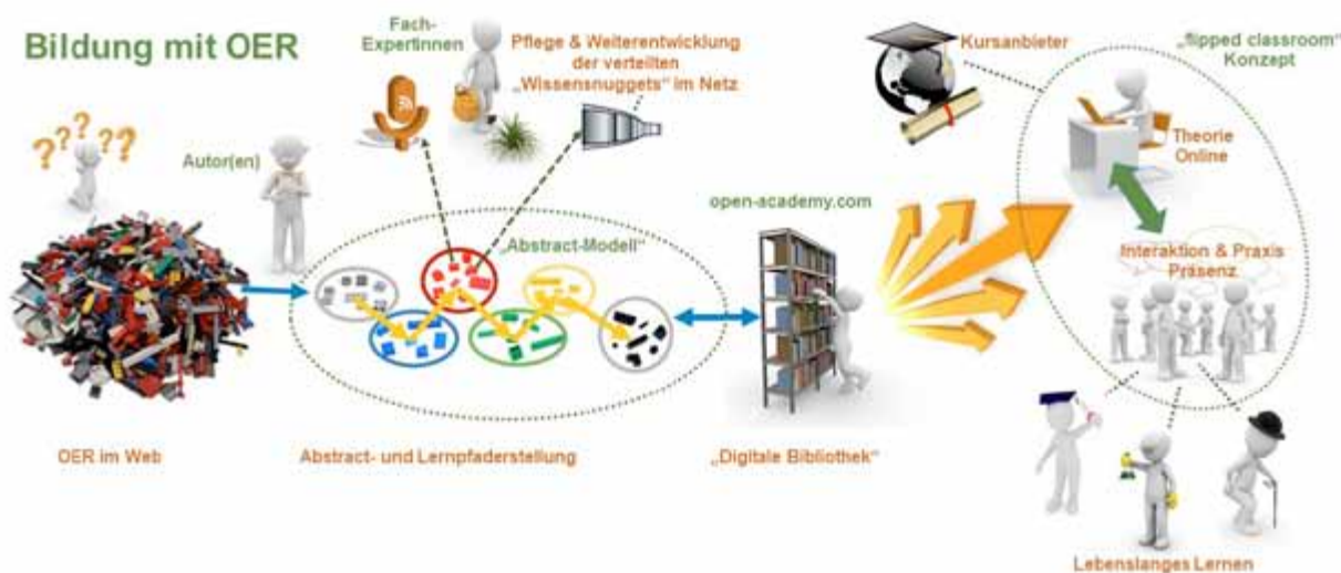
Abbildung 7: Bildung mit OER als Ergebnis der digitalen Transformation