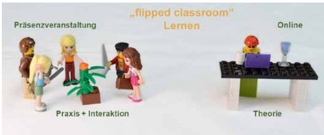
Abbildung 2: "Flipped Classroom" - Lernen mit OER (Theorie online)

Video und interaktive Tests, Übungen, Simulationen und Spiele zu kombinieren und auch für unterschiedliche Lerntypen anders anzubieten, in Kombinationen, wie es durch konventionelle Medien (z.B. Buch) nicht möglich ist.