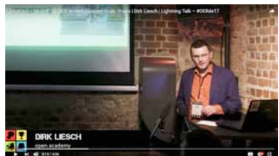
Abbildung 3: "Abstract-Modell", #OERde17

Beim Abstract-Modell (siehe: Lightning Talk während der OER-Fachtagung 2017 zum „Abstract-Modell“ auf YouTube, Dauer: 4:36min) werden „Online Fachbücher“ zu komplexen Themenbereichen durch nach Lernpfaden geordnete Abstracts realisiert.