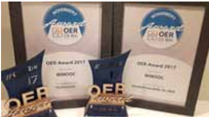
Abbildung 6: OER - Award auch für Geschäftsmodelle

In der Schulbildung und im Hochschulwesen wird Zeit und Leistung der Angestellten aus öffentlichen Mitteln bezahlt. Eine effiziente Nutzung dieser Steuergelder sollte hier im Interesse der Gesellschaft liegen. Qualitativ hochwertige freie Bildungsinhalte können die Effektivität und Fairness in unserem Bildungssystem zweifelsfrei verbessern. Für die Erstellung dieser Bildungsinhalte ist somit „nur“ eine geringere Umverteilung vorhandener Mittel erforderlich. Es werden in diesen Bereichen keine neuen Geschäftsmodelle benötigt, sondern lediglich der Wille der Politik und der Beteiligten. Sowohl freiwillig als auch gesetzlich wäre es möglich alle mit öffentlichen Geldern finanzierten Lernmaterialien als OER zu erstellen, ohne zusätzliche Mittel dafür zu benötigen.